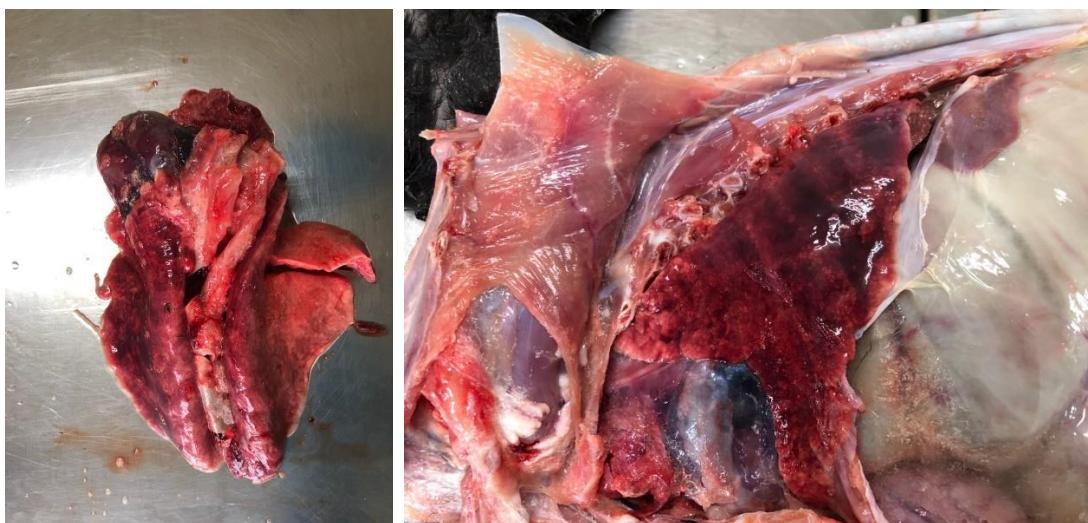
ภาพที่ 1 ปอดแพะ หมายเลข SBF 1081 จากโครงการเลี้ยงแพะพระราชทานฯ ค่ายสมเด็จพระเอกาทศรถ จ. พิษณุโลก