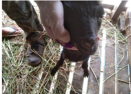
ภาพที่ 2 แสดงแพะป่วยเป็นโรคปากอักเสบ พุพอง (contagious ecthyma หรือ orf) จำนวน 2 ตัว ซึ่งได้ทำการรักษาจนมีอาการหายเป็นปกติและสามารถปล่อยกลับไปรวมฝูงได้