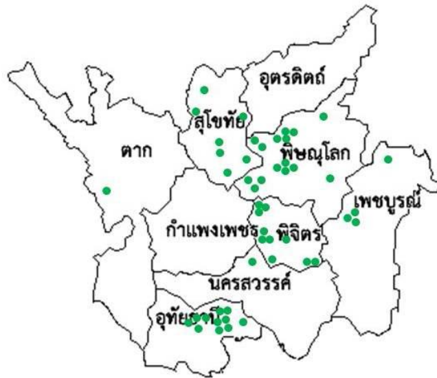
ภาพที่ 1 แสดงพื้นที่โรงฆ่าสัตว์ที่ผ่านเกณฑ์มาตรฐาน

ผลการทดสอบคุณภาพเนื้อสัตว์ (เนื้อสุกร เนื้อไก่) จากโรงฆ่าสัตว์ที่ได้รับใบอนุญาตในจังหวัดพิษณุโลก กำแพงเพชร ตาก นครสวรรค์ พิจิตร เพชรบูรณ์ สุโขทัยอุตรดิตถ์ และอุทัยธานี ที่พบเชื้อจุลินทรีย์ จำนวน 183 ตัวอย่าง พบว่า มีความชุกของการปนเปื้อนจุลินทรีย์แต่ละชนิด ได้แก่ Salmonella spp. 59.76% Staphylococcus aureus 91.72% Enterococcus spp. 71.01% Escherichia coli 68.05% Coliform bacteria 81.66% และ Total Bacteria count 62.72% (ดังภาพที่ 2) เมื่อวิเคราะห์ปัจจัยเสี่ยงที่มีผลต่อการปนเปื้อนเชื้อจุลินทรีย์ในเนื้อสัตว์จากโรงฆ่าสัตว์ที่ได้รับใบอนุญาตในเขตพื้นที่ภาคเหนือตอนล่างของประเทศไทย ได้แก่ ด้านสภาพโรงฆ่าสัตว์ ด้านอาคารโรงฆ่าสัตว์ ด้านสุขาภิบาล ด้านกระบวนการฆ่าสัตว์ และด้านการขนส่งเนื้อสัตว์ ( p = <0.001 ) (ดังตารางที่ 2)