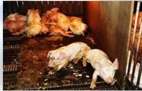
รูปที่ 2 แสดงการติดเชื้อโรค PEDV ที่ทำให้เกิดอาการท้องเสียรุนแรง https://petpigs.com/education/disease-and-conditions/pedv-guidelines-for-pet-pigs/