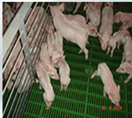
รูปที่ 4 แสดงลูกสุกรป่วยจากโรค PHEV https://www.frontiersin.org