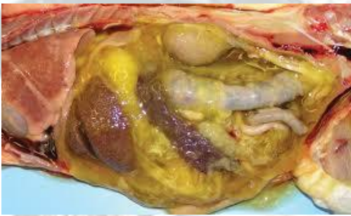
รูปที่ 1 แสดงภาพช่องท้องอักเสบของโรค FIP https://www.cliniciansbrief.com/article/feline-infectious-peritonitis