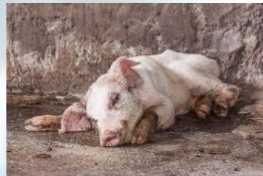
รูปที่ 6 แสดงอาการลูกสุกรท้องเสียจากโรค PDCoV

http://www.poultrydvm.com/condition/infectious-bronchitis