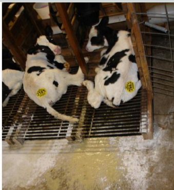
รูปที่ 3 ลูกโคแสดงอาการท้องเสีย ของโรค BCoV https://www.vdl.umn.edu