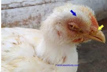
รูปที่ 5 ไก่เนื้อที่แสดงอาการโรคหลอดลมอักเสบติดต่อ (IBV)

http://www.poultrydvm.com/condition/infectious-bronchitis