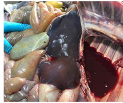
ภาพที่ 2 แสดงภาพอวัยวะภายในได้แก่ กระเพาะอาหาร ปอด และตับ จากการผ่าชันสูตรซากไม่พบรอยโรคความผิดปกติในอวัยวะสำคัญ

สรุปผลการชันสูตรซาก พบหญ้าอาหารอัดแน่นในกระเพาะอาหารรุนแรงซึ่งเป็นสาเหตุให้แพะมีอาการท้องอืด (Bloat) ซึ่งอาจเป็นสาเหตุให้แพะเสียชีวิตได้ ซึ่งในหน้าฝนจะพบว่ามีหญ้าม้วนขึ้นเยอะและแพะมักจะกินหญ้าม้วนขึ้นไปเป็นจำนวนมากทำให้เกิดแก๊สในกระเพาะอาหารเป็นจำนวนมาก แพะแสดงอาการ กระวนกระวาย น้ำลายยืด หายใจลำบากและตายในที่สุด