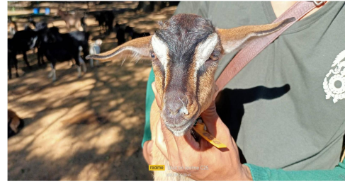
ภาพที่ 3 แสดงแพะป่วยเป็นโรกระบบทางเดินหายใจ มีน้ำมูกขึ้น จำนวน 2 ตัว ซึ่งปัจจุบันได้ทำการรักษาจนมีอาการหายเป็นปกติและสามารถปล่อยกลับไปรวมฝูงได้